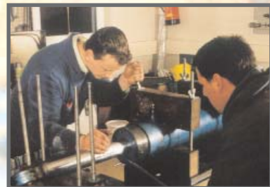
Zerlegen des Zylinders

Neben Standard- und Sonderdichtungen, Prototypen- und Spezialdichtungen, Großdichtungen bis 4 Meter Durchmesser und kompetenter Anwendungsberatung bei Dichtungsproblemen wird der Bereich der Zylinderreparatur künftig stark forciert werden.