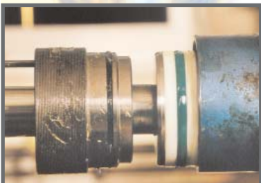
Zusammenbau und Prüfung des Zylinders

Die Kante am Übergang von der Ansträgung zur Gleitfläche muß abgerundet und poliert werden.