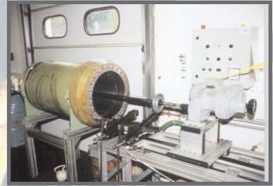
Eingespannter Grosszylinder aus dem Bereich Schwerindustrie