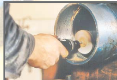
Polieren des Zylinderrohres bzw. des Einbauraumes