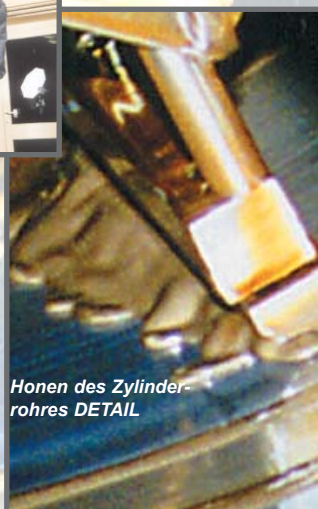
Honen des Zylinderrohres DETAIL