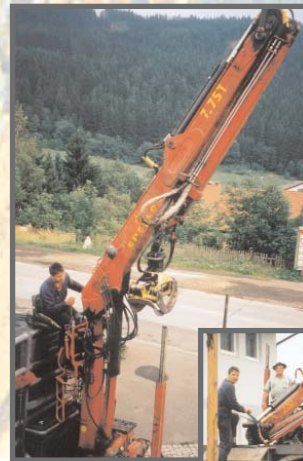
Kundenbereich Land- und Forstwirtschaft