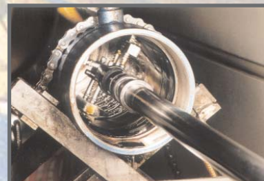
Honen des Zylinderrohres

Scharfe Kanten sind zu entgraten bzw. mit Fasen oder Radien zu versehen. Auf keinen Fall dürfen scharfkantige Werkzeuge verwendet werden. Dichtungen, Kolbenstange und Zylinderrohr müssen vor der Montage eingölt oder eingefettet werden.